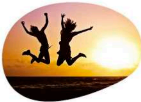
Estancias para Jóvenes