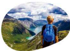
Estancias para Adultos