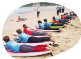
Campamentos para Niños

L'Alliance Française te propone un amplio catálogo de estancias lingüísticas según tus gustos y objetivos en Francia, Suiza y Canadá